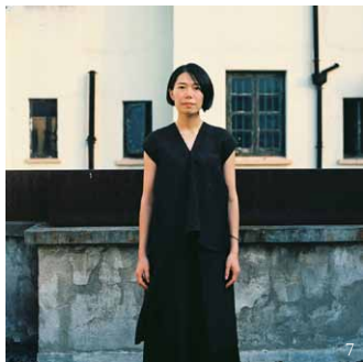
11-14. 服装设计, 夏木+消化, 2013