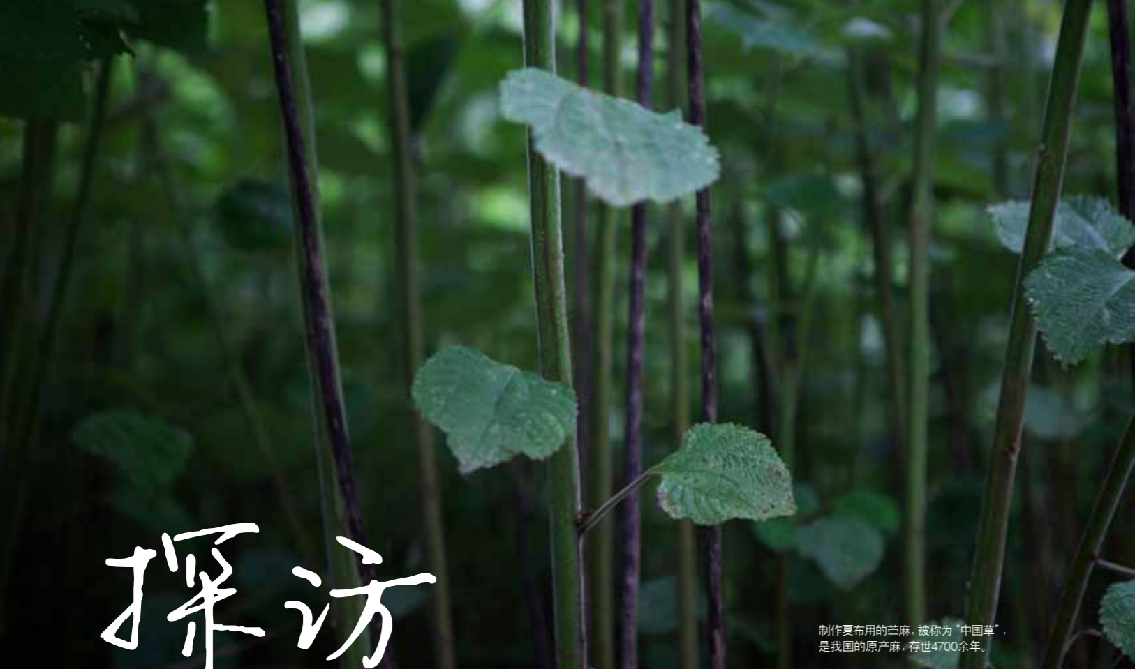
制作夏布用的苧麻，被称为“中国草”，是我国的原产麻，存世4700余年。