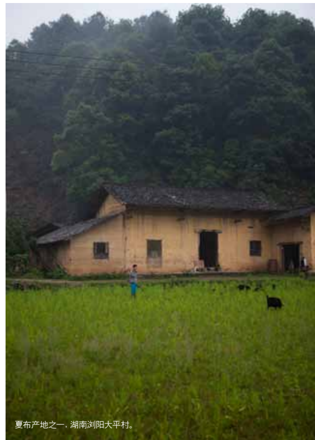
夏布产地之一，湖南浏阳大平村。

明代著作《天工开物》中，曾有关于“夏服”的记述。“夏服”顾名思义，即适合于夏季的服装，而用于制作夏服的物料，正是凉爽宜人的苧麻夏布。不同于棉布的细软或丝物的柔滑，夏布所裁制的衣物，外形挺括而富有垂感，天生带有一种君子气节，暗藏兰竹之雅与智慧巧思，以至于明、清年间，夏布除了是朝堂上的贡品佳物，也曾一度享誉海外。在当时，颇具名望的夏布产地有江西宜丰、重庆荣昌、四川隆昌、浙江天台、湖南浏阳等。其中，宜丰夏布以种类取胜，其布料分为粗细几等，被赞为“平如水镜，轻如罗绡”。而重庆荣昌的夏布，早在唐、宋时就被奉为贡品，由于这里出产的布匹幅宽较大，常被文人用于书画，还有“夏布中的画布”一说。同样是在蜀地，四川隆昌的夏布，集合了传自湖广的织造经验与本地特色，曾一举赢得海内外青睐，使夏布成为中国最早出口的纺织品。此外，浙江的天台、湖南的浏阳，历来都以盛产苧麻而闻名，因而前者有“南山苧麻”的美誉，后者有“以杭州纺绸换浏阳夏布”的佳话。